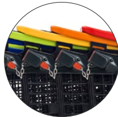
Cadena inicio Starter chain