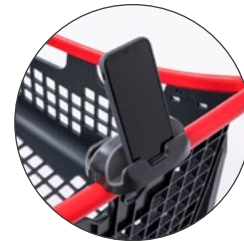
Portamóviles Mobile phone holder