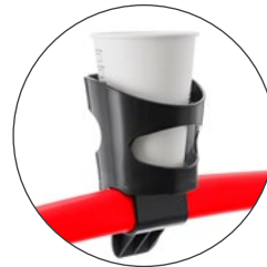
Porta-bebidas universal Universal drink holder