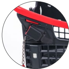
Monedero adaptado Adapted coin lock